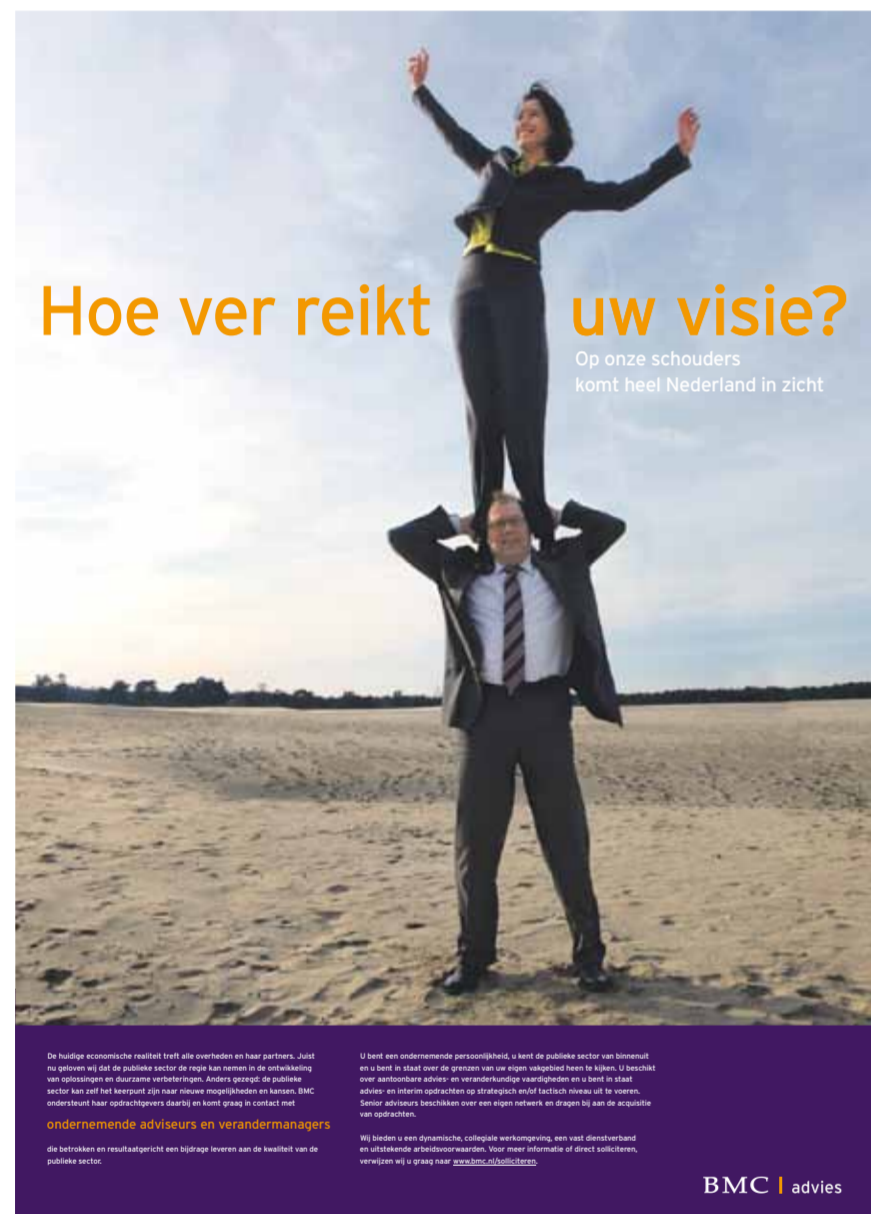
Advertentie december 2009